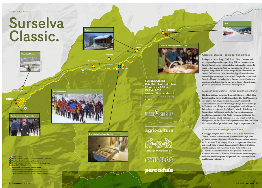
Abb. 2: Als Partner von Surselva Classic hat der Parkkandidat Parc Adula eine Karte zum Anlass erstellt: Der Park bringt sich mit dem Parkperimeter, mit der Verpflegung von lokalen Spezialitäten sowie dem öffentlichen Verkehr ein (Quelle: Parc Adula).

Mehrwert gegenüber den «Nichtparkgebieten» entsteht. Im Wildnispark Zürich Sihlwald sind es die Ranger, welche Beobachtungen wie z.B.