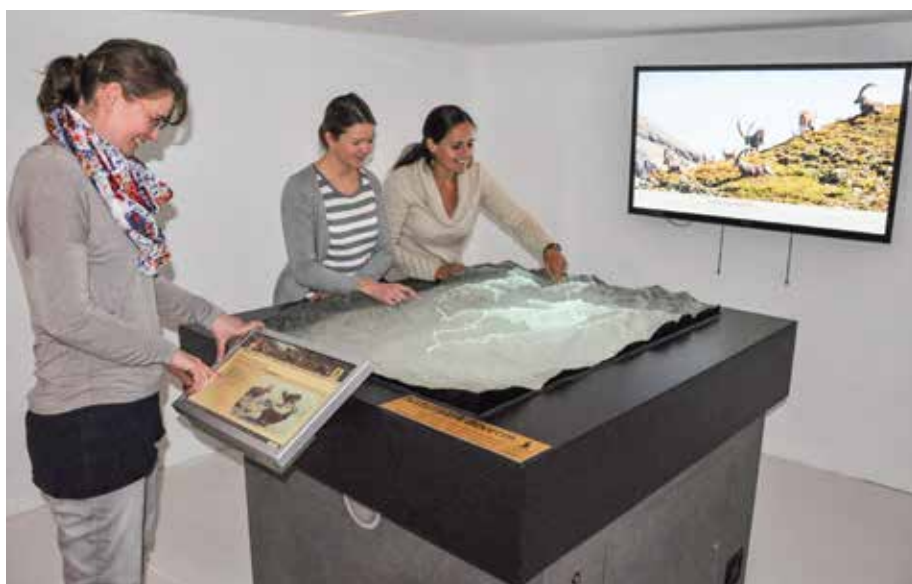
Abb. 3: Plexiglas-Relief im Center da Capricorns in Wergenstein im Naturpark Beverin.

Pärke von nationaler Bedeutung sind auch interessant für die Forschung in verschiedensten Disziplinen. Und auch in diesem Umfeld spielen raumzeitliche Aspekte und damit Karten eine grosse Rolle. In der UNESCO Biosphäre Entle-